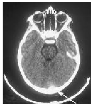
Figura 4: TC de cerebro. Se observa un pequeño hematoma extradural sobre el trazo de fractura que se muestra en la Figura 1.