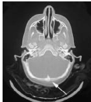
Figura 3: B. F. niña de 4 año de edad. Sufrió caída de 1m de altura. TC con ventana para hueso. Se observa trazo de fractura occipital parasagital.

Representan el 1.7% del total de los traumatismos leves (Figuras 3 y 4). Ninguna de ellas requirió tratamiento quirúrgico. Permanecieron internados entre 3 y 7 días. (Tabla 6)