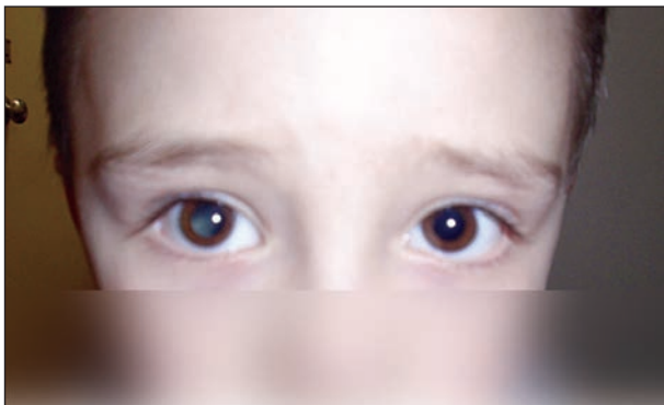
Figura 1: Examen ocular.

A la inspección presenta leve desviación divergente del OD, y a la evaluación de su actitud visual se observa dudosa fijación con ese ojo y buen seguimiento con ojo izquierdo (OI). Figura 1.