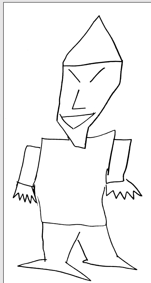
“Un chinito, habla en chino”