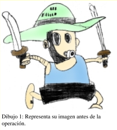
Dibujo 1: Representa su imagen antes de la operación.

Finalmente aceptan la intervención motivados por la posibilidad de que ella beneficie su crecimiento. Los dibujos 1, 2 y 3 así lo sugieren.