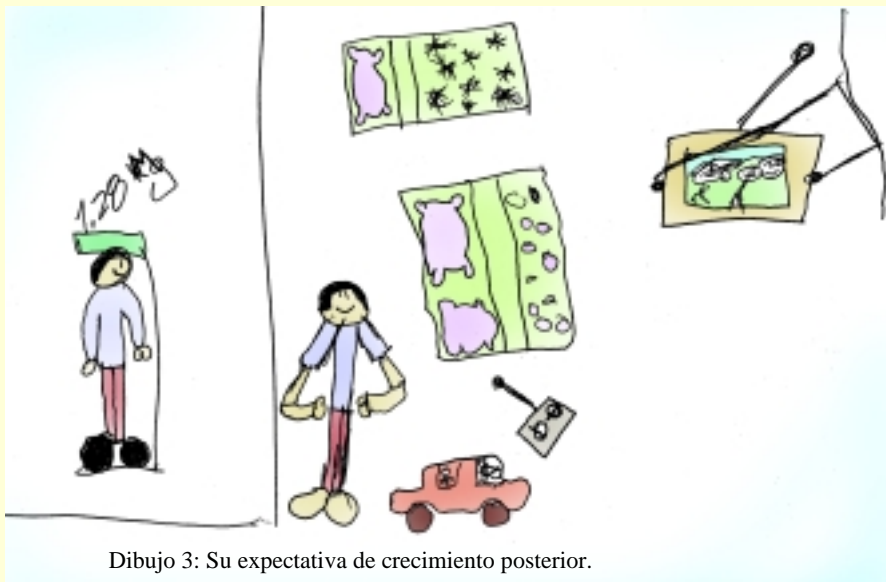
Dibujo 3: Su expectativa de crecimiento posterior.