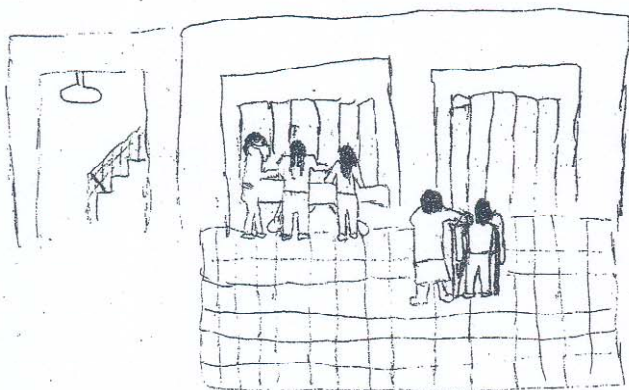
Dibujo N° 1: Paciente de 14 años. Cirugía de abdomen.

El imaginar la situación de quirófano y dibujarla ayuda al niño a desplegar cuáles son las fantasías preexistentes al momento de su operación.