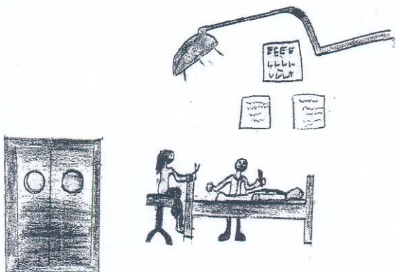
Dibujo N° 3: Paciente de 11 años. Cirugía oftalmológica.